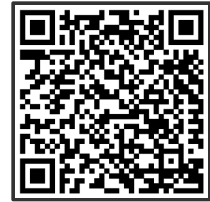
All Learning Content Related to this Topic

Solutions: Freust du dich auf den Filmabend morgen? / Ja, ich bin schon sehr aufgeregt! Hast du dich schon entschieden, welchen Film wir anschauen? / Ich dachte entweder an einen Action- oder einen Animationsfilm. Was ist dir lieber? / Ich mag keine Actionfilme. Wie wäre es mit der neuen Komödie mit Jim Carey? / Das ist eine gute Idee. Ich habe gehört, dass sie gute Kritiken bekommen hat. / Sollen wir noch mehr Leute einladen? / Ich habe bereits Lisa und Lukas eingeladen. Soll ich sonst noch jemanden fragen? / Nein, ich denke das sind genug Leute. Hast du Snacks besorgt? / Ich habe Popcorn, Chips, Gummibärchen und Limonade gekauft. Ich denke wir sind bereit! / Super. Dann sehen wir uns morgen Abend.