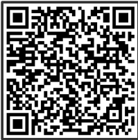
Listen to the Dialogue